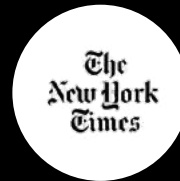
The New York Times